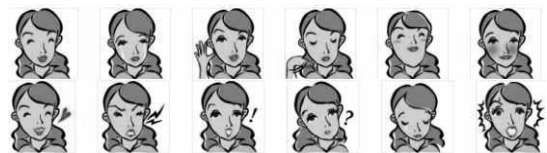
Fig.2 Examples of avatar representations.

(注) 左上から「うれしい」、「悲しい」、「同意した」、「同意しない」、「得意な」、「恥ずかしい」、「感謝の」、「怒った」、「称賛した」、「疑問」、「自責の」、「驚いた」