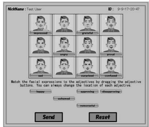
図1 表情と形容詞を対応づけるパズルゲームとして提示される実験画面の例

ボタンとして提示される形容詞12個はすべて同じ選択肢(次節参照)であり、それぞれの形容詞が表示される位置は実験を通して固定されている。表示される形容詞は、a)で取得した被験者の母国語と同じ言語が表示されるよう、日本語、韓国語、中国語、英語、フランス語、イタリア語、スペイン語、ドイツ語の8つの言語の切替えが可能ないように設計されている。デフォルトは英語である。なお、形容詞に使用される単語は、各言語のネイティブスピーカー3名に妥当