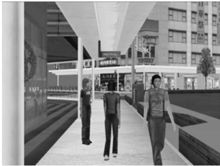
図 3 仮想空間 (四条河原町) でのシミュレーション

と、モバイル端末を含めエージェント群は分散して配置されることになり、その間の通信帯域も多様となる。こうした環境で効率よくシナリオを実行することは今後の課題である。